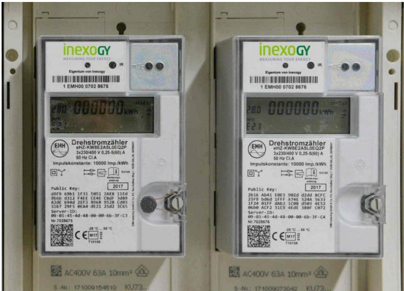
Steckbare elektronische Haushaltszähler (eHZ)